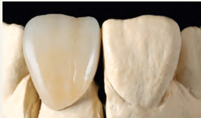
fertig bemalt und glasiert