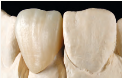
vor dem Bemalen und Glasieren